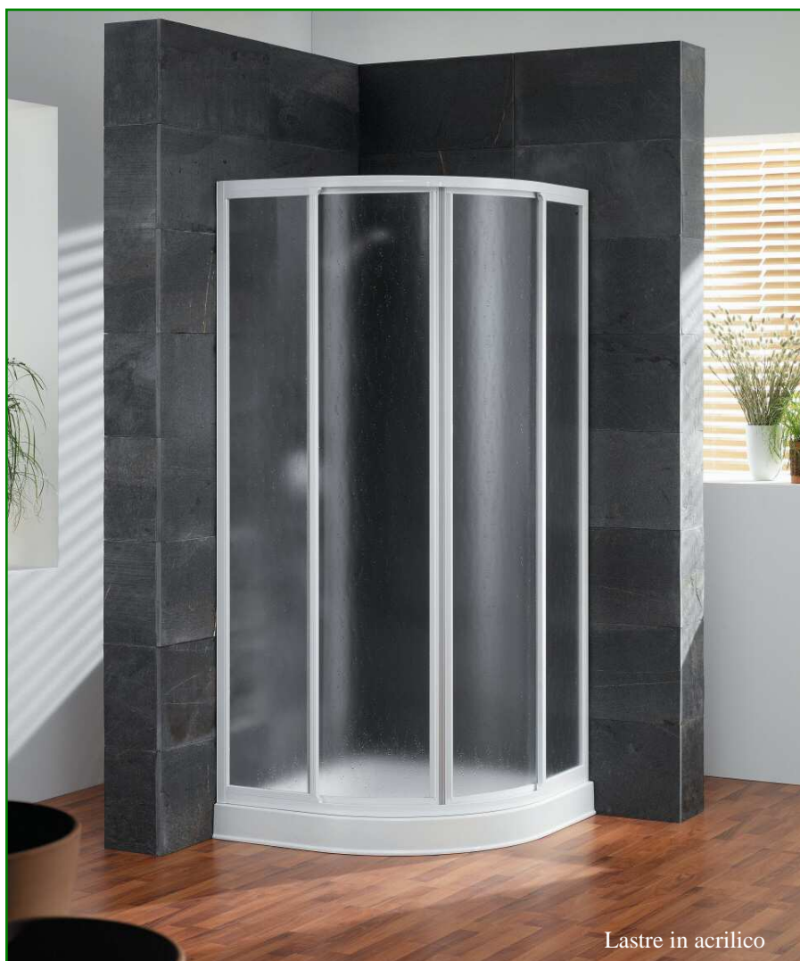
Lastre in acrilico