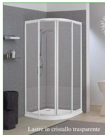
Lastre in cristallo trasparente