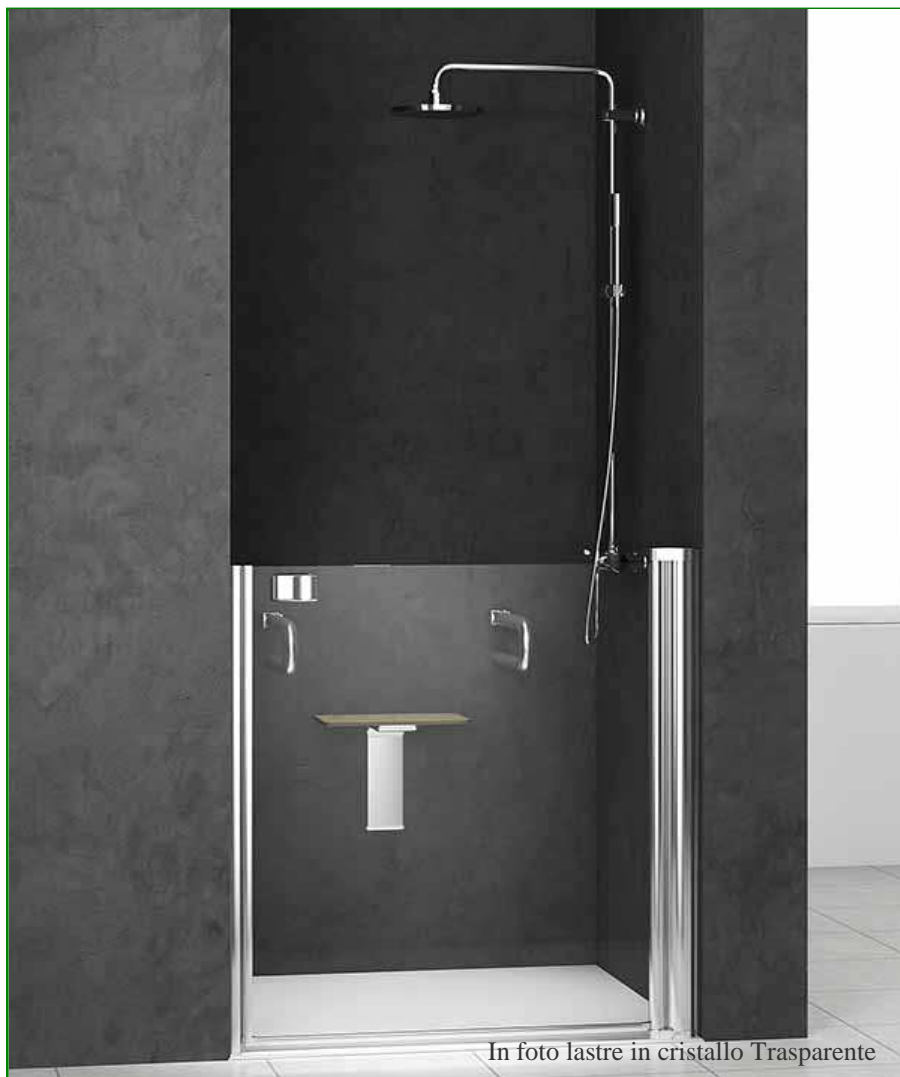
In foto lastre in cristallo Trasparente