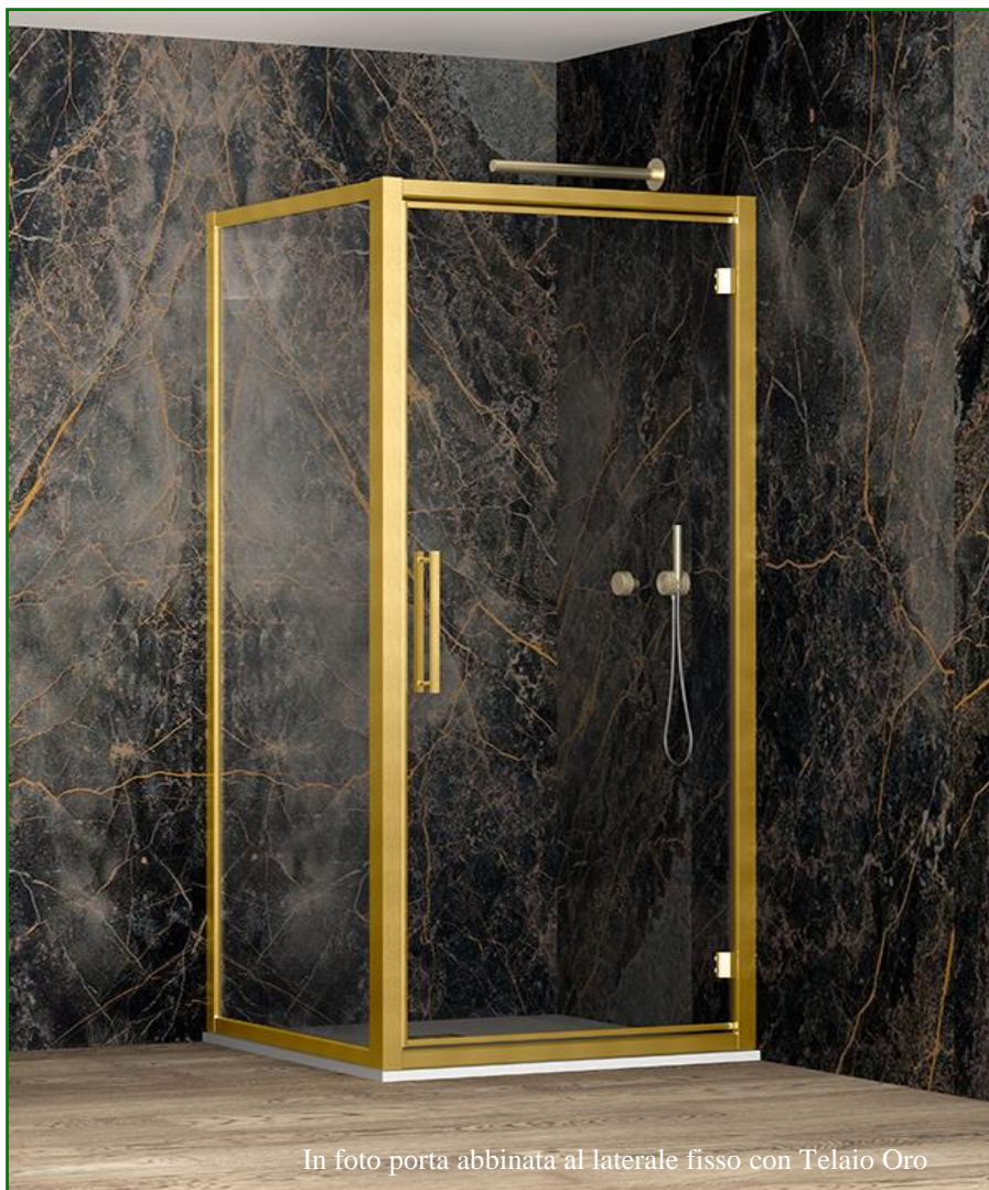
In foto porta abbinata al laterale fisso con Telaio Oro