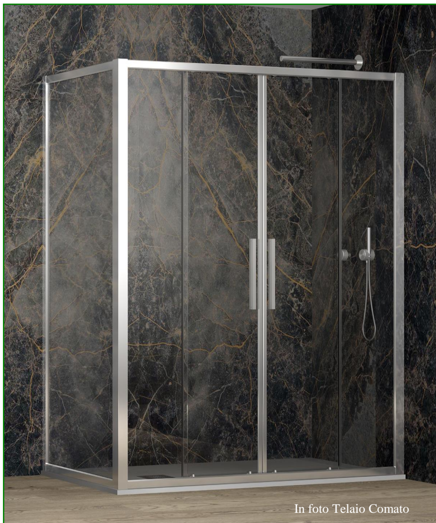
In foto Telaio Comato