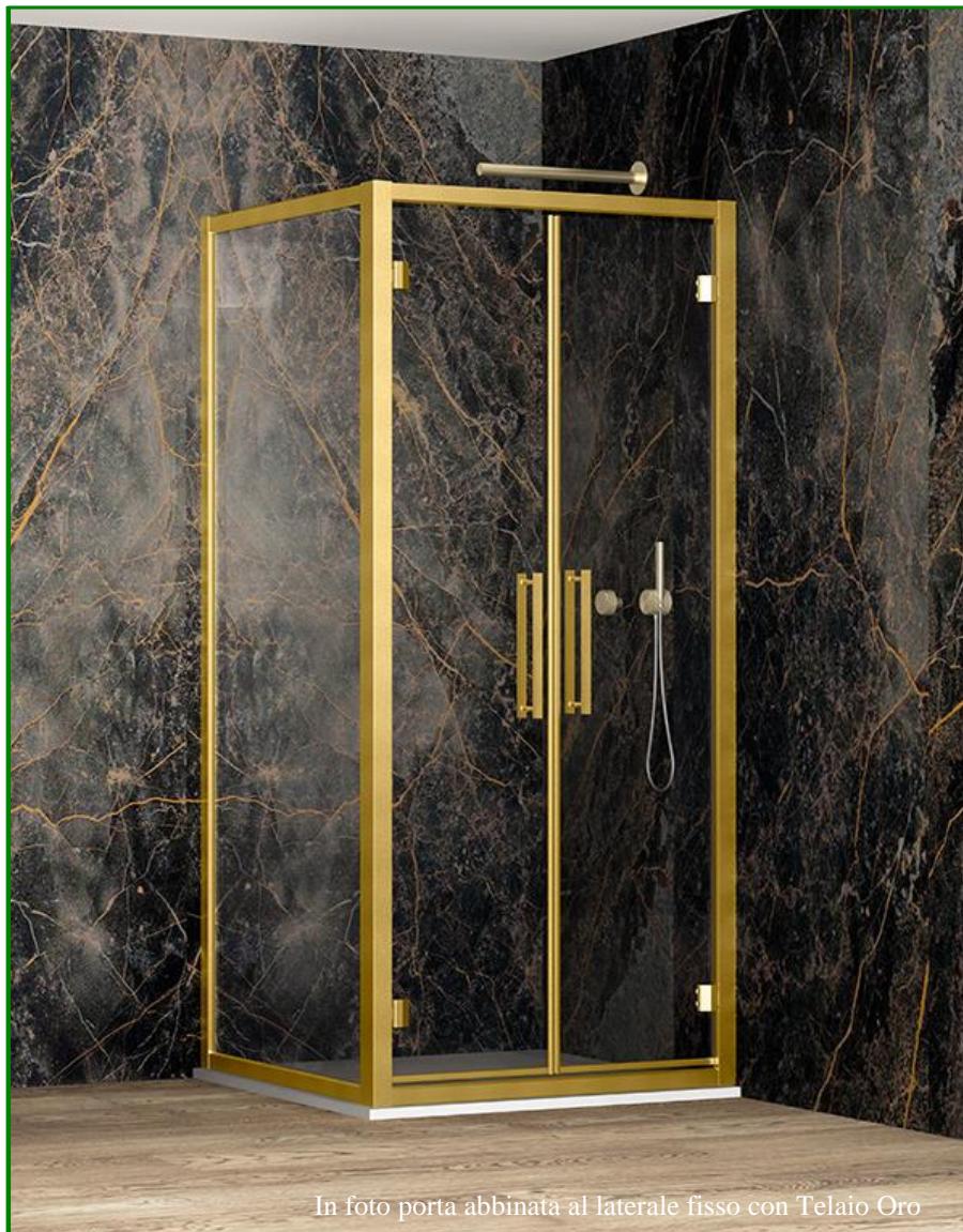
In foto porta abbinata al laterale fisso con Telaio Oro